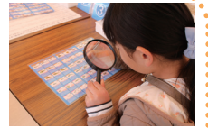
ちりめんモンスターをさがせ