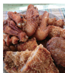
江田島 ポーク&チキン