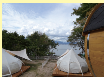
グランピング施設の見学

似島会場だけでしか味わうことができない、似島ゆかりの特産グルメ、お楽しみ抽選会もあるよ！当日は無料チャーター便もご用意！