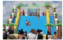
ふわふわスライダー

子どもが楽しめる遊び・学びの体験ブースや、大人も思わず足を止める展示などが盛りだくさんの広場です。