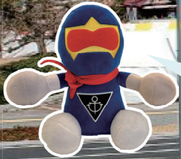
おもてなし戦隊 みなとんジャー

「みなとでつながる海と島と人」をテーマに、「第10回広島みなとフェスタ」を開催。通常規模の開催は4年ぶりになります。ステージや乗船企画のほか、たくさんの飲食や体験コーナーなどのブースが並びます。園広島みなとフェスタ実行委員会(地域起こし推進課 ☎250-8935、☎252-7179)