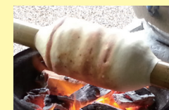
バウムクーヘン作り体験